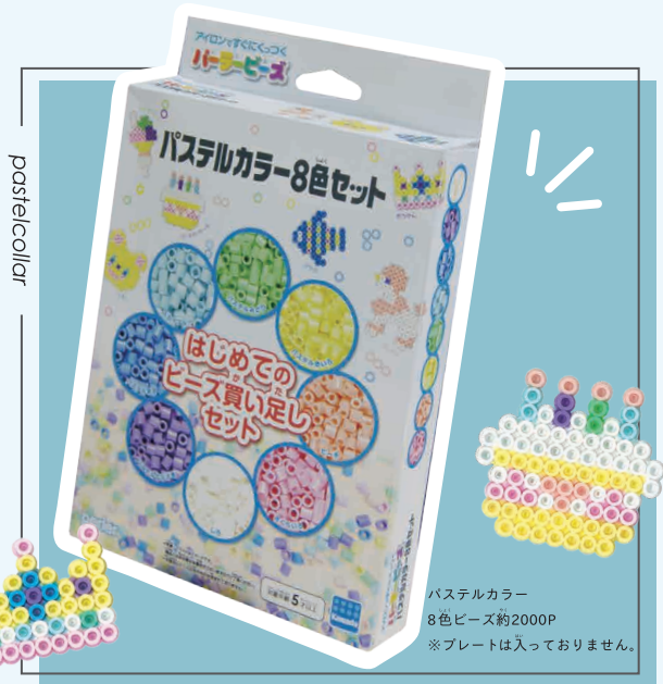
パステルカラー8色セット