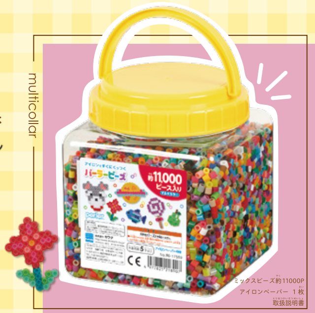
筒入り11000P マルチカラー