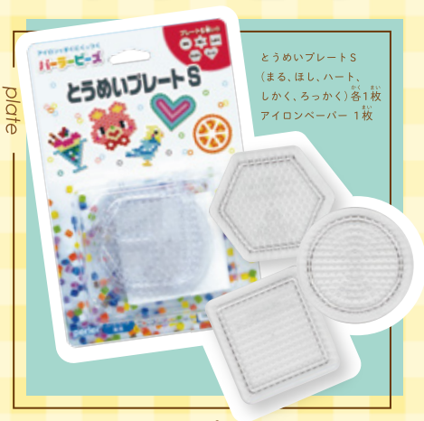
とうめいプレートS