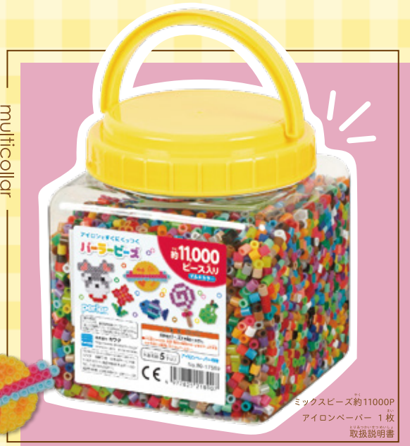
筒入り11000P マルチカラー