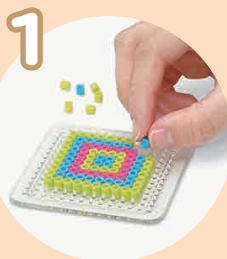
ビーズをならべて