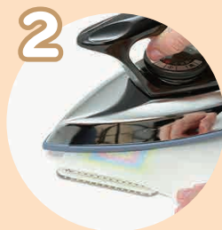
アイロンをかけて